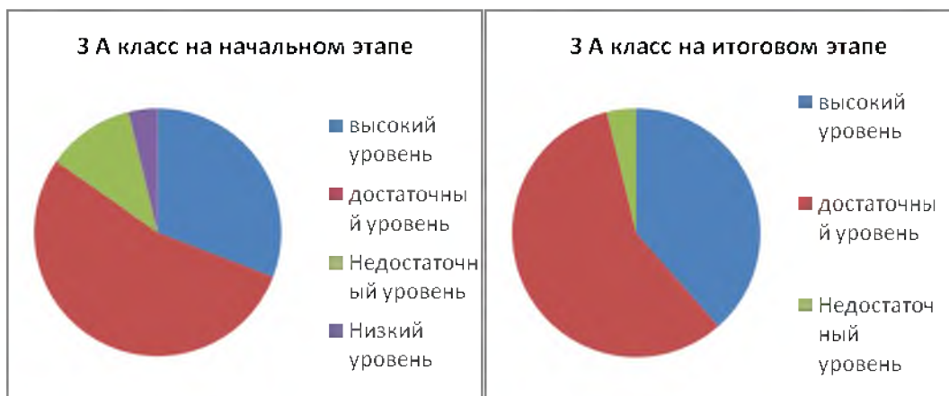
Рис. 1 – Диаграмма 1-2 «Результаты мониторинга умений организовать здоровьесберегающую жизнедеятельность у обучающихся экспериментального класса»